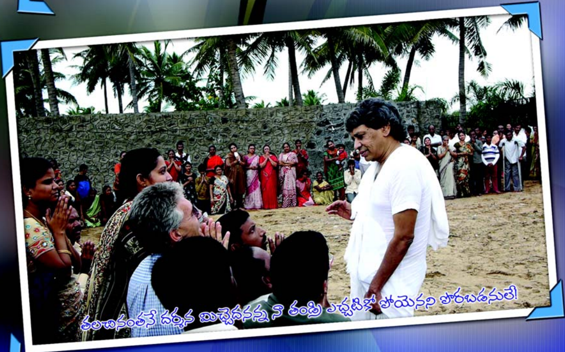
తండ్రికంటే నర్తక మిచ్చేదనన్ను నీ తండ్రి ఎప్పుటికీ పోయెనని పొరబడనులే!